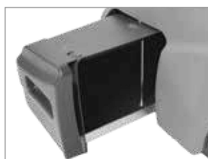
AMPIO CONTENITORE RIFIUTI ANTERIORE