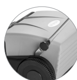
Sistema di bloccaggio del manico pratico e veloce