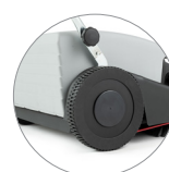
Grandi ruote posteriori