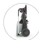
Dimensioni compatte: facile da riporre