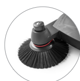
Spazzole laterali regolabili in altezza