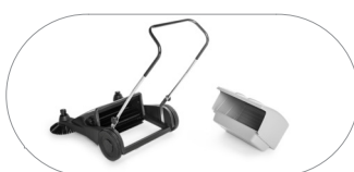
Contenitore rifiuti di grande capacità