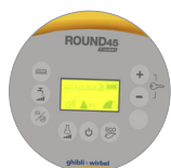
Pannello di controllo con display