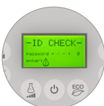
Password utente, praticità e sicurezza