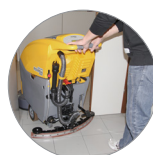
Tergitore regolabile e compatto