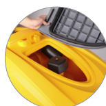
Debris tray + filtro motore aspirazione