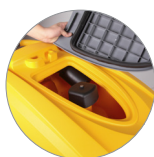
Debris tray + filtro motore aspirazione