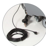
Cavo 25 m nella dotazione standard