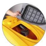
Debris tray + filtro motore aspirazione