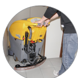
Tergitore regolabile e compatto