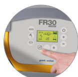
Funzione modalità silenziosa