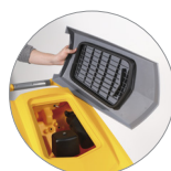
Debris tray + filtro