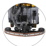
Tergitore regolabile ... ... e compatto